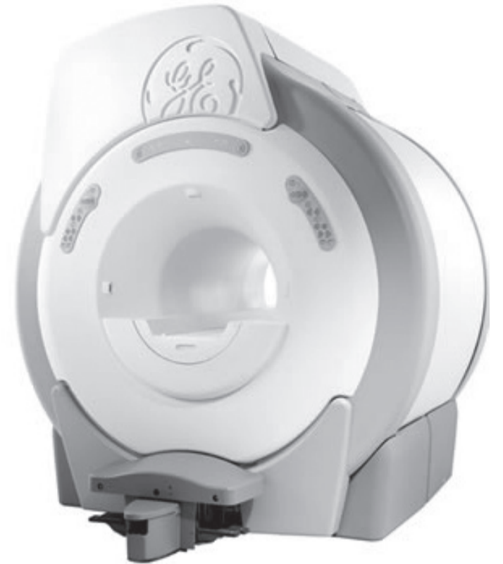
Aparelho de ressonância magnética de campo fechado proporcionará a comodidade de não precisar sair da cidade para realizar alguns procedimentos

Com Ressonância Magnética de Campo Fechado novos exames serão realizados em Bragança